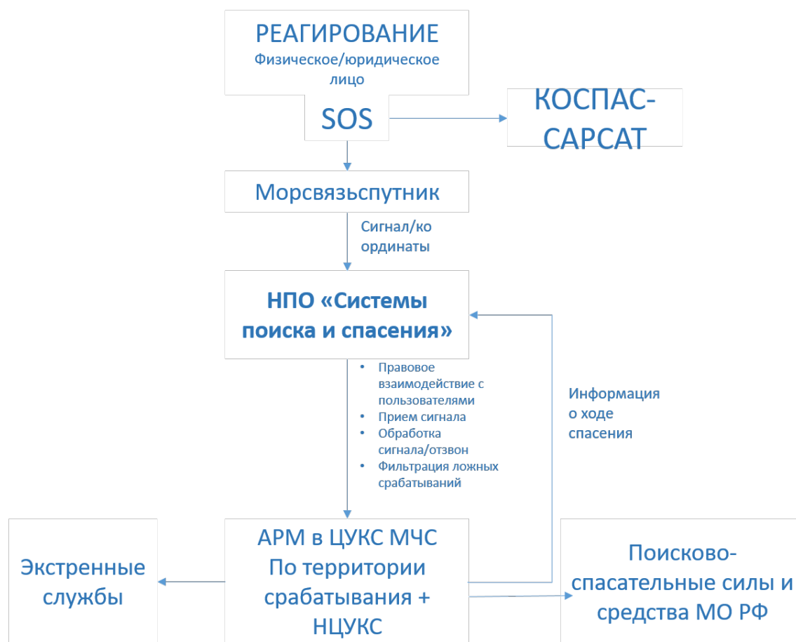
Рисунок 1. Схема работы НПО «Системы поиска и спасения»