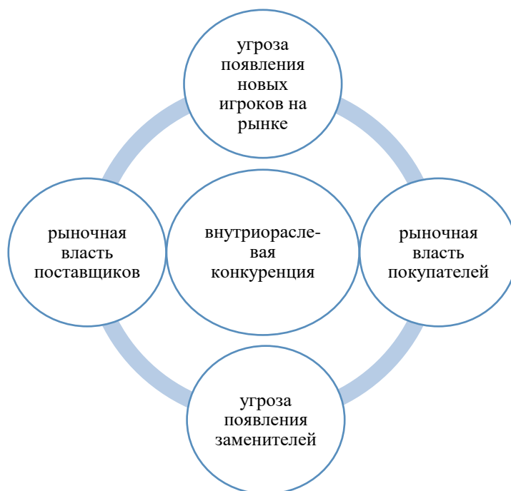
Рисунок 2. Пять конкурентных сил М. Портера

Именно эти пять сил определяют степень привлекательности той или иной отрасли, а их анализ позволяет более четко понять отраслевой контекст, в котором компания осуществляет свою деятельность, оценить конкурентное пространство во всех перспективах. Кроме того, данный инструмент позволяет изучить привлекательность потенциально новых отраслей, также оценить стратегическую позицию компании на рынке.